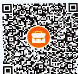
群名称：2023年测绘科学技术奖-1 群 号：754610492