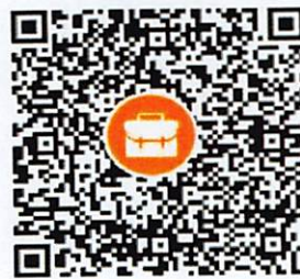
群名称：2023年测绘科学技术奖-3 群 号：757052686