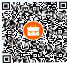
群名称：2023年测绘科学技术奖-2 群 号：220257496